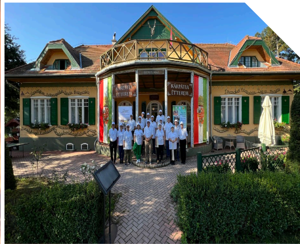
KÁRPÁT-MEDENCEI FOTÓSOK TALÁLKOZÓJA