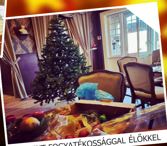
ADVENT FOGYATÉKOSSÁGGAL ÉLŐKkel