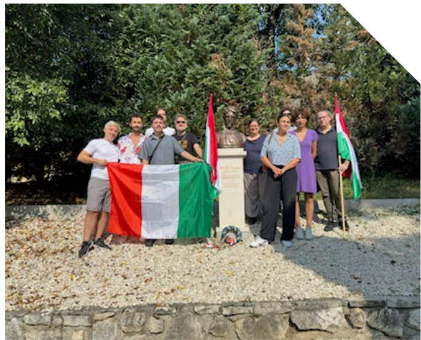
OLASZ–MAGYAR SZAKFORDÍTÓ TÁBOR