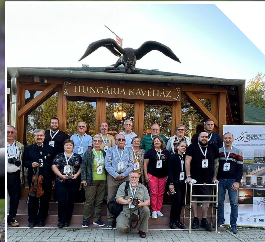
KÁRPÁT-MEDENCEI MAGYAR JELENLÉT