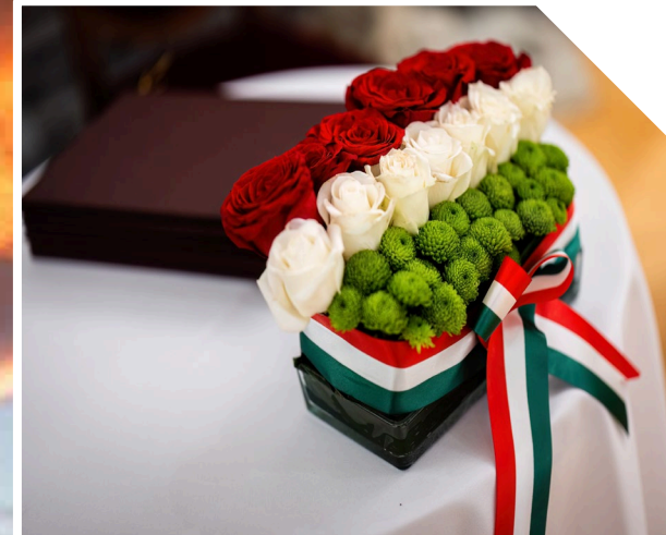
NEMZETI ÖSSZETARTOZÁS NAPJA