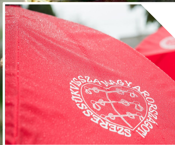
KÁRPÁT-MEDENCEI ÖSSZETARTOZÁS KOLLÉGIUM