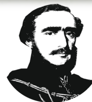
GRÓF SZÉCHENYI ISTVÁN NÉPFŐISKOLA