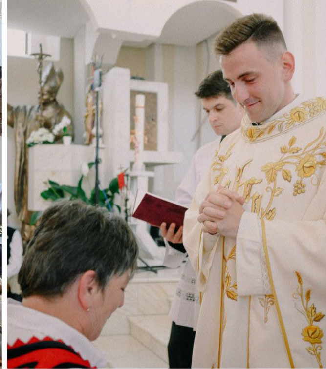
Volt kórustag papszentelése, primíciája